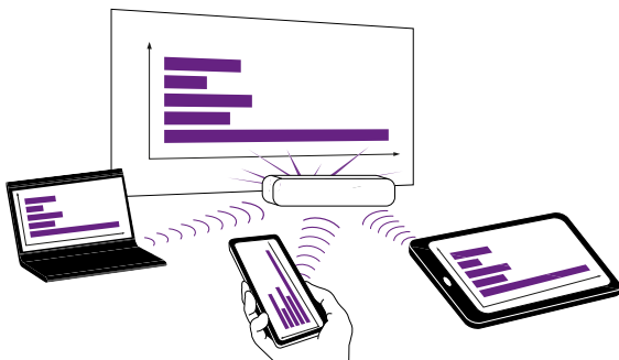
Presentazioni flessibili con l'app Mobi Show.

Grazie all'app Mobi Show 1,4 è possibile collegare cellulari e tablet PC direttamente al proiettore, tramite connessione WLAN, e trasferire direttamente al proiettore le presentazioni salvate su tali apparecchi.